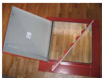
Bild 2. Överbeslag och pannprofilsbeslag.