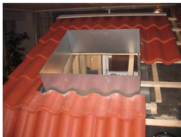
Monteringsbild 1. Söga upp ca 655 x 955 mm. Kontrollera att det inte finns t ex. en takstol, som förhindrar upp/nedstigning, där du vill ha takluckan.

Övre delen av underbeslaget, sidan upp motnock, sticks under underlagspappen. Övriga tre sidor läggs på underlagspappen. Skruva fast underbeslaget med de 12 st medföljande skruvarna (monteringskruv 25 mm). Läkta därefter färdigt runt underbeslaget.