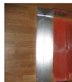
Bild 3. Underbeslag, plisséplåt och påse med monteringsdetaljer.