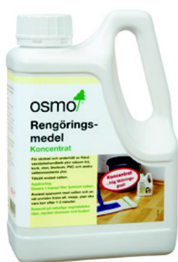
1 Osmo 8016 Rengöringsmedel