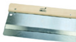
11 Osmo Dubbelspackel