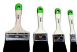
7 Osmo Pensel