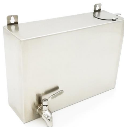
Kuumavesisäiliö kiukaan sivulle