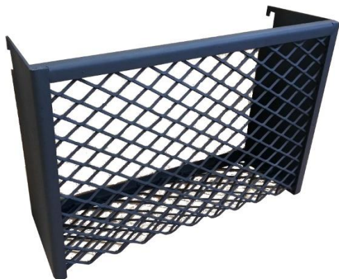
Kiviritilä kiukaan sivulle