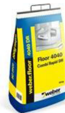
15kg säck med handtag

Floor 4040 combi rapid DR är ett fin- och byggspackel med pastakonsistens. Produkten innehåller aluminatcement som är lågalkaliskt. Produktens konsistens kan varieras med vattenblandningen. Kornstorlek; 0,5 mm. Floor 4040 combi rapid DR är tredjepartskontrollerad av SP, Sveriges Tekniska Forskningsinstitut, P-märkt, CE-märkt och uppfyller AMA Hus krav. Floor 4040 combi rapid DR är karakteriserad som Polymermodifierad: CT-C25-F7 enligt EN 13813.