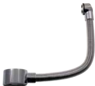
Distansring För tvättställ, med bräddavlopp. Förkromad mässing. Art nr 857 35 86