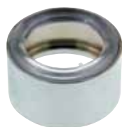
Distansring För tvättställ, utan bräddavlopp. Förkromad mässing. Art nr 857 35 87