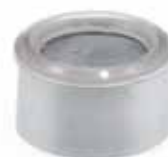
Distansring För tvättställ, utan bräddavlopp. Förkromad ABS. Art nr 857 36 06