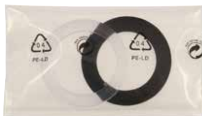
Packningssats Till vipplugg- och silverventiler. Passar till samtliga Alterna Bottenventiler Art nr 857 36 03