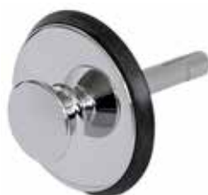
Plugg till vippluggventil Passar till Art nr 857 3574, 857 35 82, 857 35 84, 857 35 85. Art nr 857 35 83