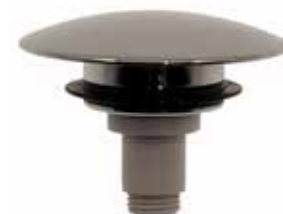
Pop-Up Plugg Passar till Art nr 857 35 78 Art nr 857 36 02