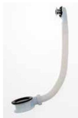
Distansring För tvättställ, vit i ABS med bräddavlopp. Art nr 857 36 05