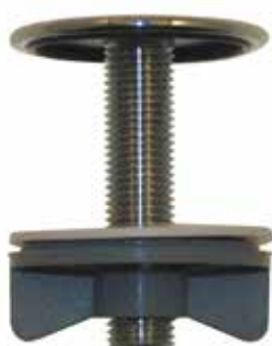
Täckbricka 43 mm med skruvtapp och vingmutter. Art nr 834 80 23