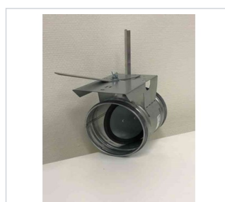
art.nr: 380138 Spjäll 200 Typ 4 m. motorhylla