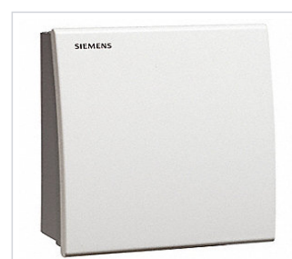
art.nr: 340099 Luftkvalitegivare CO2 Rum QPA 2000