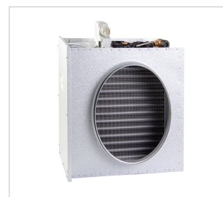
art.nr: 399145 VB-sats A170T EC Kyla