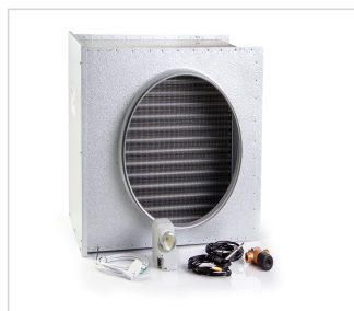
art.nr: 399144 VB-sats A170T EC Värme