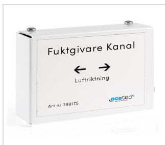
art.nr: 399175 Fuktsensor EvoControl kanal