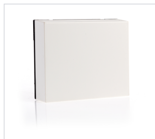
art.nr: 340124 Fuktsensor EvoControl rum