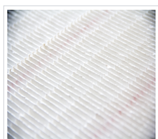
art.nr: 380001 Filter A200S/A170T ePM1 55%