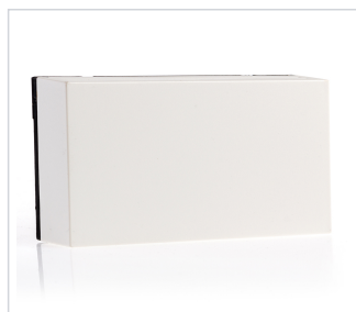
art.nr: 399188 Fuktsensor rum programmerad