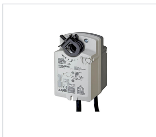
art.nr: 340098 Spjällmotor Fjäder 230V GPC321.1A