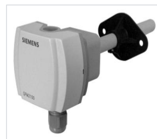
art.nr: 340113 Luftkvalitegivare CO2 Kanal QPM2100