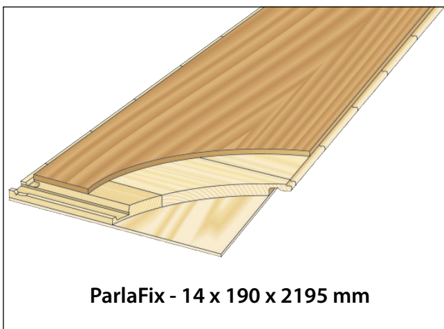
ParlaFix - 14 x 190 x 2195 mm