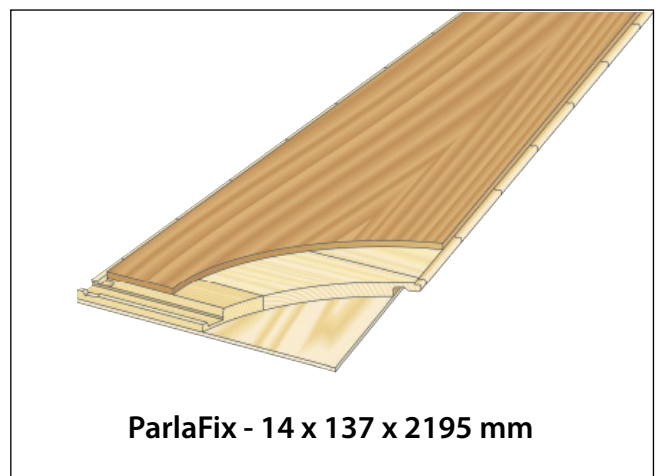
ParlaFix - 14 x 137 x 2195 mm